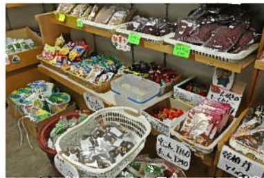
乾物・駄菓子など