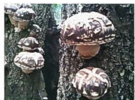
生しいたけは、焼いて食う!!最高!!

椎茸原木 500円/本 駒入れ 900円/本 来年の3月末から順次配送いたします。 町外は送料を別途いただきます。