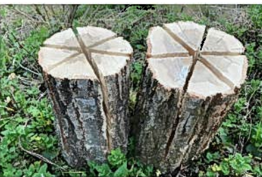
スウェーデントーチ