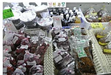
梅漬・みそ・金山寺

ご注文・お問い合わせは、みさくぼ路の里（売店）まで 電話 053-987-1921 営業時間 9:00~17:00