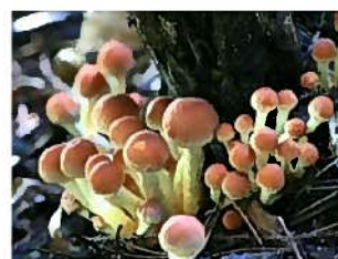
ナメコのお味噌汁は格別! クリタケも汁物や鍋に!!