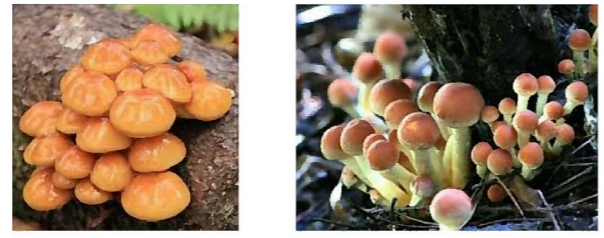
ナメコのお味噌汁は格別! クリタケも汁物や鍋に!!