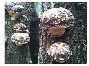
生しいたけは、焼いて食う!!最高!!

椎茸原木 500円/本 駒入れ 1,000円/本 表示価格は税込価格です。 3月末頃から順次配送いたします。 町外は送料を別途いただきます。