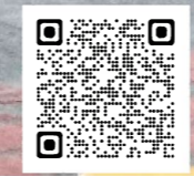
ホームページQRコード

長年に亘り、ご愛顧いただきありがとうございました。 心より感謝とお礼申し上げます。